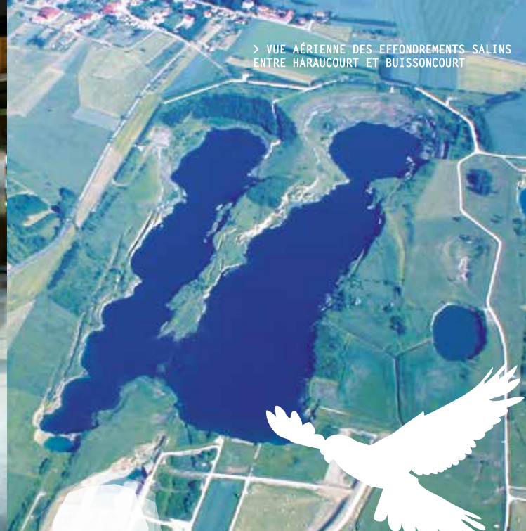
> VUE AÉRIENNE DES EFFONDEMENTS SALINS ENTRE HARAUCOURT ET BUISSONCOURT

La Maison du Sel : une étape incontournable pour tout connaître de ce minéral essentiel à la vie.